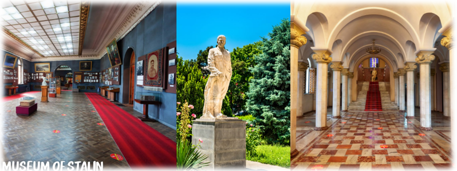
MUSEUM OF STALIN

นำท่านออกเดินทางสู่ เมืองกอรี (GORI) ทุกวันนี้ เป็นเมืองแห่งประวัติศาสตร์ เป็นที่รู้จักกันดีว่าเป็นบ้านเกิดของ “โจเซฟ สตาลิน” (Joseph Stalin) ชาวจอร์เจียที่ในอดีตเป็นผู้ปกครองสหภาพโซเวียต ในยุคศตวรรษที่ 1920 ถึง 1950 และมีชื่อเสียง เรื่องความโหดเหี้ยมในการปกครองในเมืองกอรีแห่งนี้